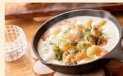
シーフードとニョッキのクリーム煮