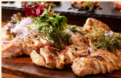
宮崎県産鶏の塩麹コンフィ