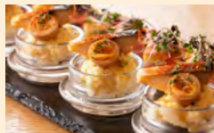
発酵ポテトサラダ ～鯖の燻製を乗せて～

「霧島黒麹」と「サワークリーム」を使用したポテトサラダに燻製した鯖をトッピングしました。