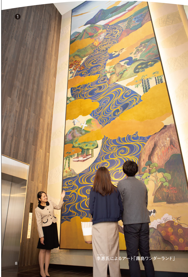
① 李恵氏によるアート「霧島ワンダーランド」