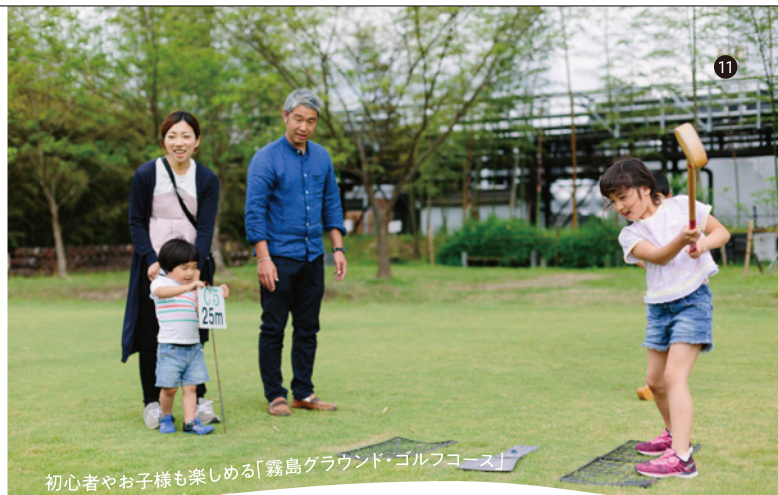
初心者やお子様も楽しめる「霧島グラウンド・ゴルフコース」