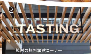
焼酎の無料試飲コーナー