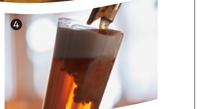
4 霧島山が育んだクラフトビール