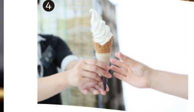
4 黒霧島を使用した焼酎ソフトクリーム