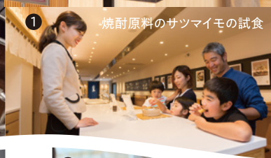
1 焼酎原料のサツマイモの試食