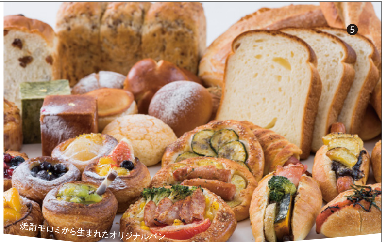
焼酎モロミから生まれたオリジナルパン