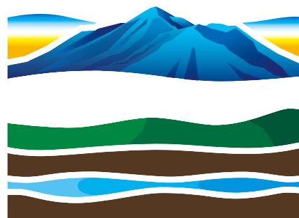
焼酎の里 霧島ファクトリーガーデン

飲酒は20歳から。飲酒は適量を。 飲酒運転は、法律で禁じられています。 妊娠中や授乳期の飲酒はお控えください。