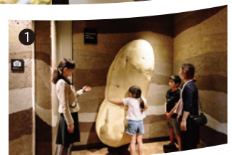
巨大サツマイモと記念の一枚