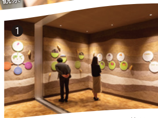
大地にもぐってサツマイモを学ぶ