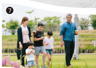
自然の彩を感じる遊歩道