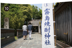
霧島山の自然の恵みに感謝する 「霧島焼酎神社」