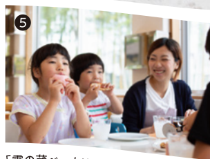
「霧の蔵ベーカリー」のイートインスペース