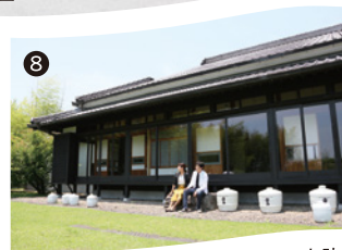
霧島の創業期を感じる「創業記念館 吉助」