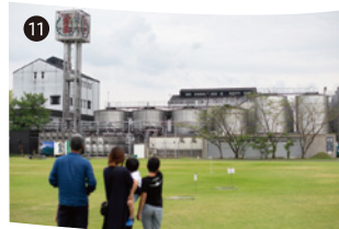
① 敷地内に並ぶ焼酎タンク