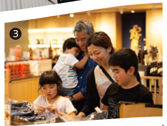
③ オリジナル商品のお買物が楽しめるショップ