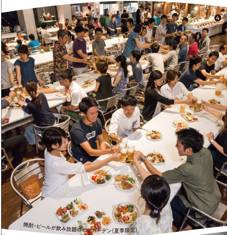
焼酎・ビールが飲み放題のビアガーデン(夏季限定)