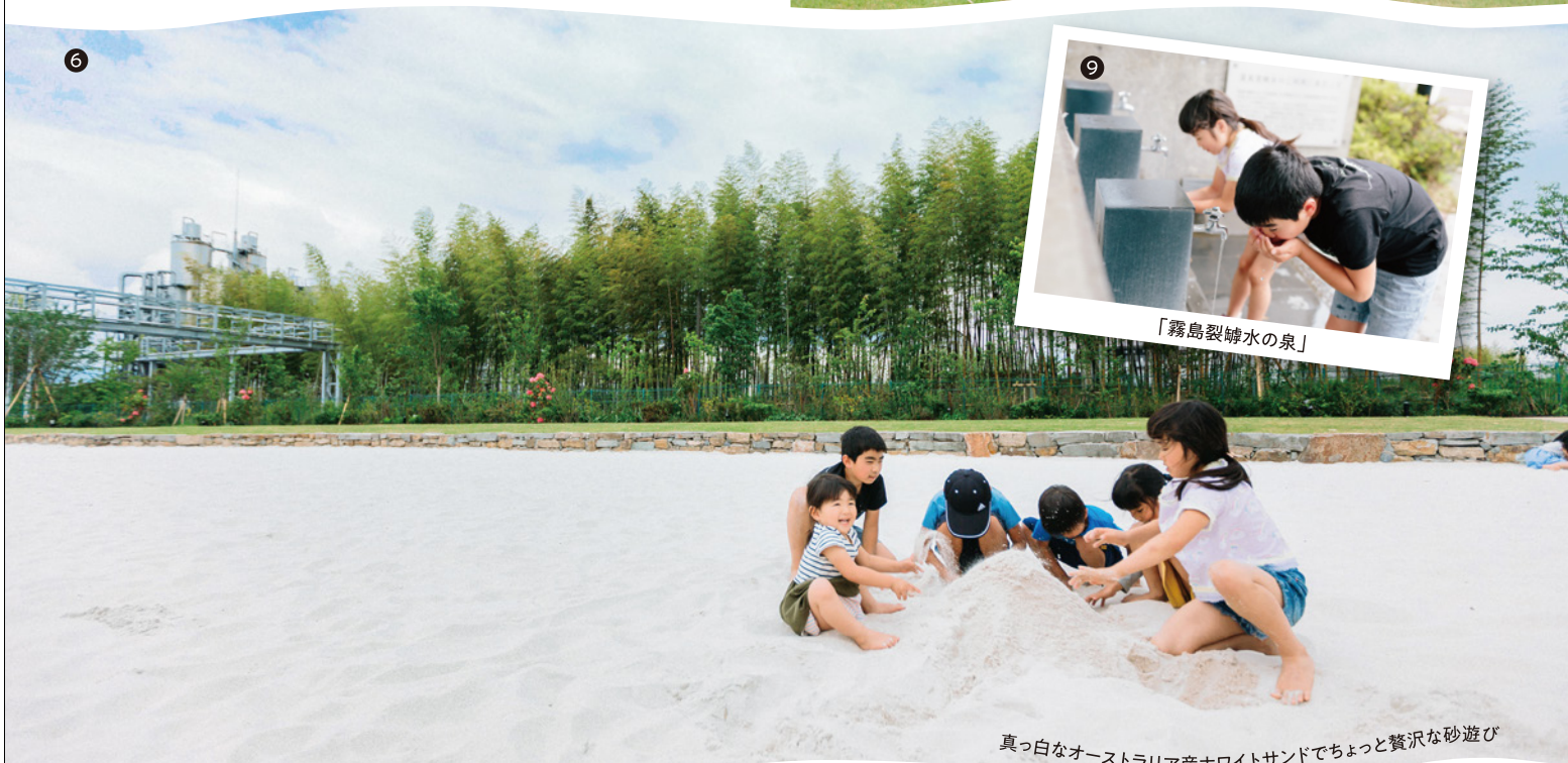
真っ白なオーストラリア産ホワイトサンドでちょっと贅沢な砂遊び