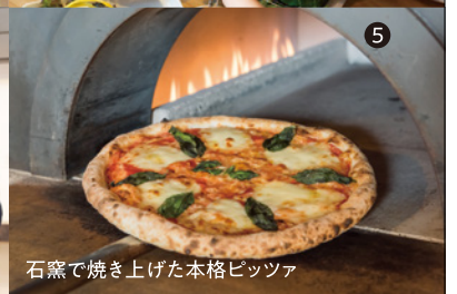
石窯で焼き上げた本格ピッツァ