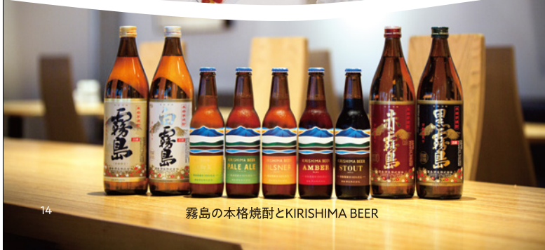
霧島の本格焼酎とKIRISHIMA BEER