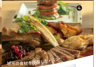
4 地元の食材を使用したメニュー