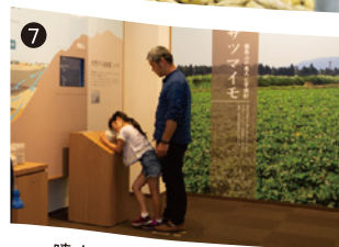
噴火で生まれた溶結凝灰岩を 顕微鏡で観察