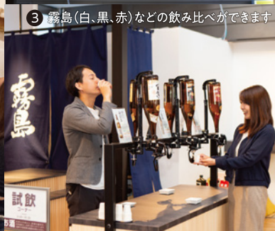
3 霧島(白、黒、赤)などの飲み比べができます