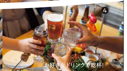
お好きなドリンクで乾杯!