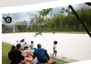
ピクニックが楽しめる芝生エリア