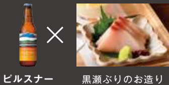
ピルスナー 黒瀬ぶりのお造り