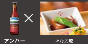
アンバー きなこ豚 KIRISHIMA BEER煮