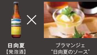
日向夏 【発泡酒】 プラマンジェ “日向夏のソース”