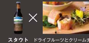
スタウト ドライフルーツとクリームチーズ 観音池ポークの生ハム