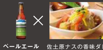
ペールエール 佐土原ナスの香味ダレ