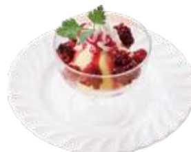
バニラアイスの ミックスベリーソース