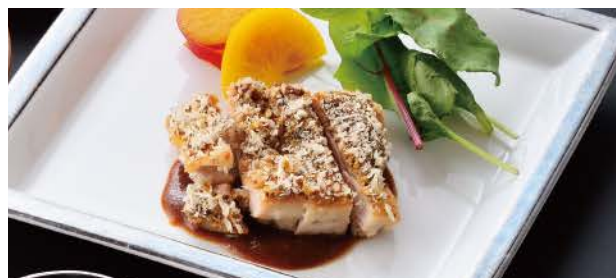
鶏もも肉のマスタード焼き さつま芋レモン煮