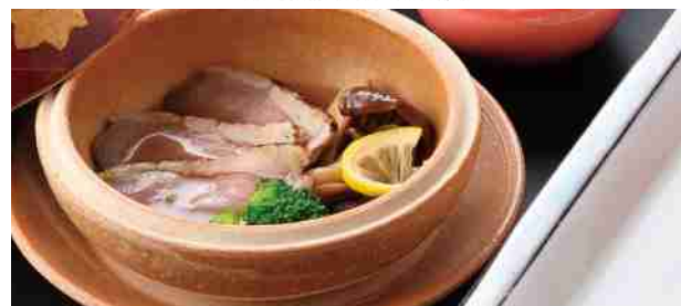
合鴨麴蒸し キノコの和風ピクルス