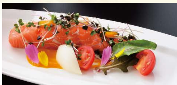
サーモンのエチューベ カボチャのクーリー