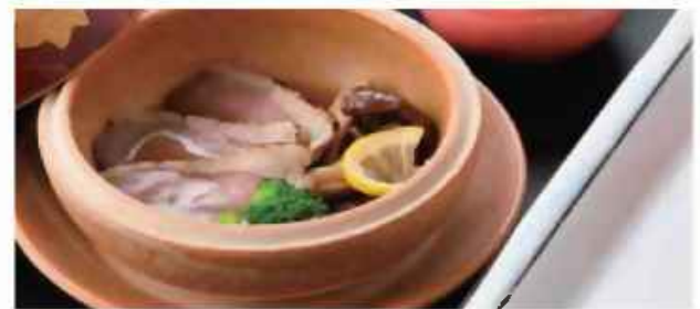
合鴨麹蒸し キノコの和風ピクルス