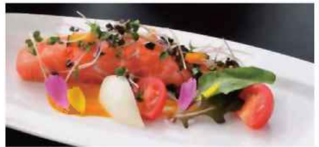
サーモンのエチューベ カボチャのクーリー