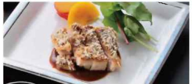
鶏もも肉のマスタード焼き さつま芋レモン煮