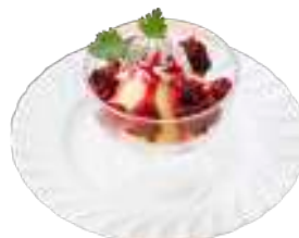
バニラアイスの ミックスベリーソース