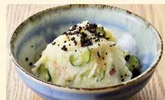
発酵ポテトサラダ

鶏出汁をベースにトマトをふんだんに使用し、オリーブオイルや生姜で洋風に仕上げました。 ※生姜鍋と日替わりでのご提供です。