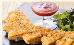
スパニッシュオムレツ 塩麹、ミンチや野菜を混ぜ、焼き上げています。

5種の根菜(ピーツ・ムラサキイモ・人参・サツマイモ、ジャガイモ)を蒸し、アパレイユで仕上げています。