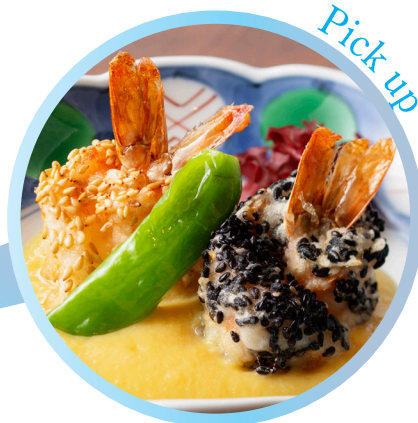
白黒ごまの海老天 ～黄身ソース～

白ごま、黒ごまを衣に纏わせた2種類の海老天をオリジナルの黄身ソースと併せてお召し上がりください。