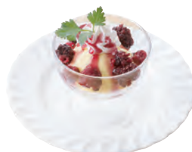
バニラアイスの ミックスベリーソース