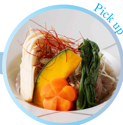
●白菜と豚バラ肉の重ね煮 ～黒麴あん～

白ごま、黒ごまを衣に纏わせた2種類の海老天をオリジナルの黄身ソースと併せてお召し上がりください。